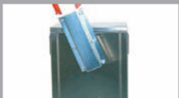
El brazo puede montarse para abrir hacia la derecha o hacia la izquierda.