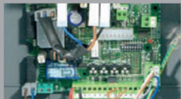
Pánel de control con todas las características estándar y conectores desmontables de fácil conexión.