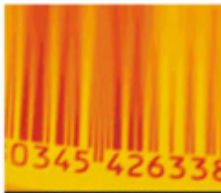
Código de barras