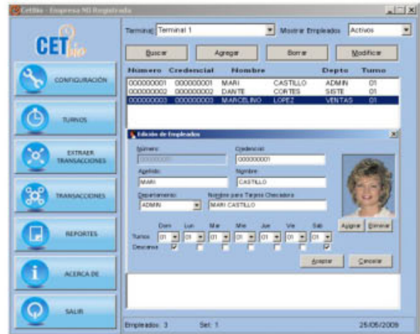
EDICIÓN DE EMPLEADOS