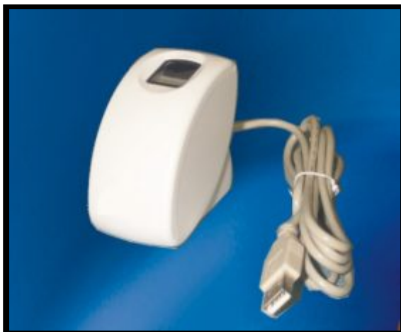
Lector de huella Mod. UF-300