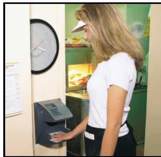
Terminal HandPunch 1000